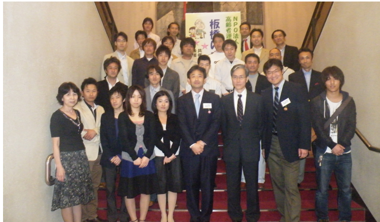
講演会を終えて、スタッフと演者たち。お疲れ様でした。