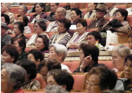
質問コーナーは大変好評です。みなさんメモをとりながら熱心に聞いていらっしゃいます。