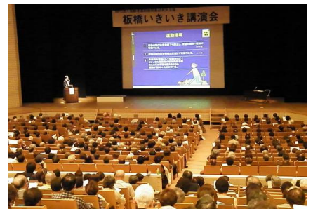
3講演ともスライドを使い、参加者全員に資料冊子を配り分かりやすく説明します。