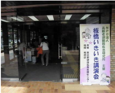
会場の板橋区立文化会館大ホールです。2階席までのエレベーターが設置され、便利になりました。