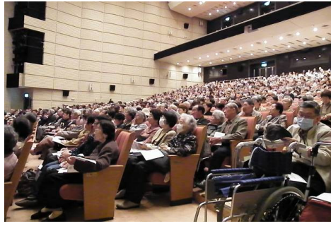
多くの皆さんに参加していただき、1階席はほぼ満席です。